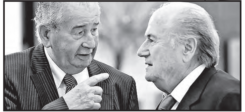
Grondona y Blatter

Grandes multinacionales, especialmente Adidas, Coca Cola y otras, tienen una relación estrecha con los conductores de la FIFA y privilegios en sus contratos publicitarios. Aunque posiblemente sea el menor de sus ingresos, el salario de estos señores es un secreto. En un momento dijeron que “en conjunto”