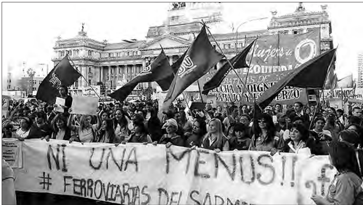
Mujeres de Izquierda Socialista junto a trabajadoras ferroviarias contra los femicidios

También se exigieron medidas efectivas para terminar con la violencia, como la declaración nacional de emergencia en violencia de género; presupuesto para la ley 26.845 de erradicación de la violencia contra las mujeres que garantizaría refugios, centros de atención a las víctimas y campañas de prevención; la creación de un registro único de denuncias y un observatorio nacio-