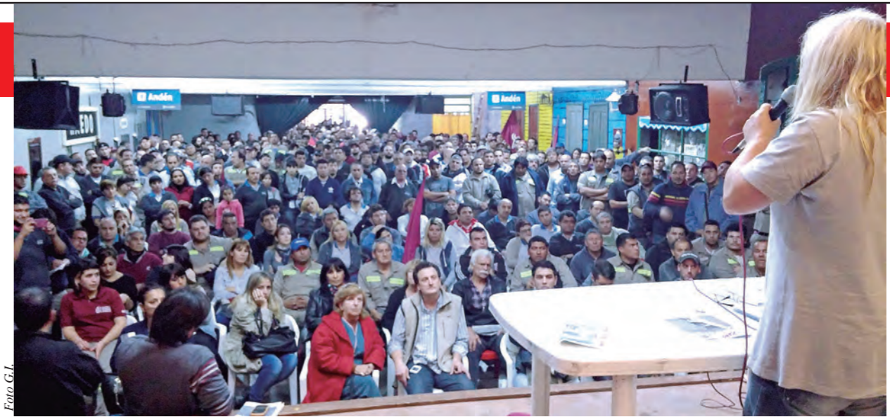
Asamblea de los ferroviarios del Sarmiento que aprobó sumarse al paro del 9. Abajo: el Encuentro Sindical Combativo estuvo presente en la jornada del paro